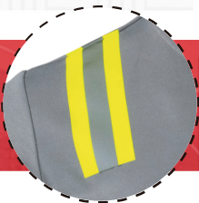
CINTA REFLECTANTE DÍA Y NOCHE