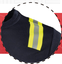
CINTA REFLECTANTE DÍA Y NOCHE