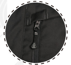
TIRADOR CON MARCA OVER MOUNTAIN