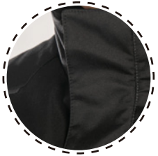
AJUSTE CENTRAL CON VELCRO