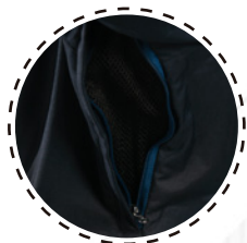
VENTILACIÓN CON CIERRE Y MESH