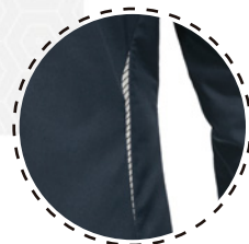
REFLECTANTES EN ESPALDA