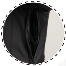
VENTILACIÓN CON CIERRE Y MESH