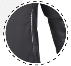
REFLECTANTES EN ESPALDA