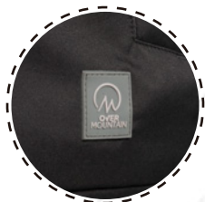
ETIQUETA MARCA PU