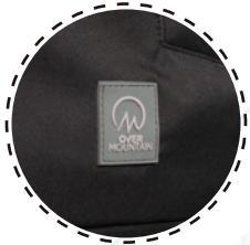
ETIQUETA MARCA PU