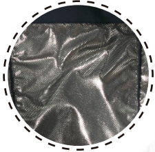
TELA TÉRMICA REFLECTANTE