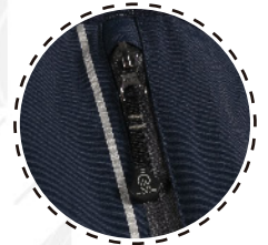
BOLSILLO CON CIERRE IMPERMEABLE Y DETALLES REFLECTIVOS