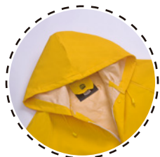
GORRO INCORPORADO AJUSTABLE