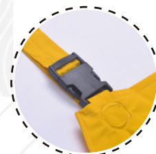
TIRANTES AJUSTABLES Y REGULABLES