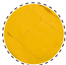
DOS BOLSILLOS PARCHE MULTIPROPOSITO