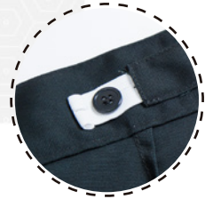
ELÁSTICO DE AJUSTE EN INTERIOR DE CINTURA