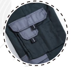
BOLSILLOS MULTIUSO CON TAPETA Y VELCRO