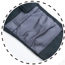
RODILLAS CON TELA REFORZADA