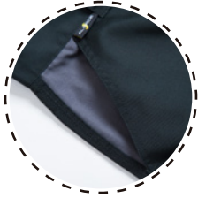
BOLSILLOS LATERALES EN TELA BI-COLOR