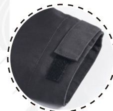
PUÑOS AJUSTABLES CON VELCRO