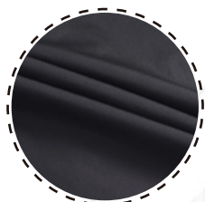
REFUERZOS DE BOLSILLOS Y CODOS EN TELA OXFORD