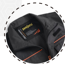
CUELLO ALTO CON VELCRO