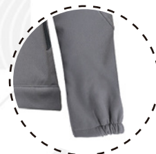
PUÑO DE MANGA AJUSTADO