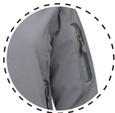
BOLSILLO EN BRAZO