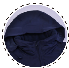
GORRO OCULTO EN CUELLO