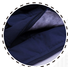
CIERRE INTERIOR PARA BORDAR PRENDA