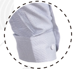
PUÑO DOBLE BOTÓN