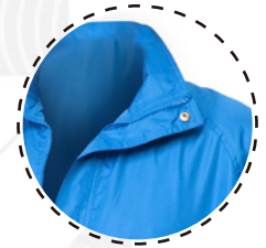
CIERRE DESMONTABLE CON TAPETA Y BROCHE

T-WORLD , es ropa corporativa de alta calidad, diseñada con estilo único, acompañando a los trabajadores y empresas de todo Chile.