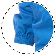
PUÑO DE MANGA CON ELÁSTICO